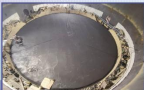
48000KVA电石炉炉底碳砖施工