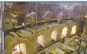
300T/D双梁石灰窑施工现场