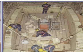
600TPD吨双梁石灰窑施工